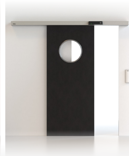
UȘĂ CULISANTĂ CIVIK ȘI DAS