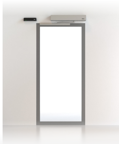
UȘĂ BATANTĂ DAB ȘI SPRINT